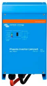
Phoenix Inverter Compact 24/1600

Toate modelele sunt prevazute cu un port RS-485. Nu trebuie decat sa conectati la calculatorul dvs interfata MK2 (vedeti, sub accesorii). Aceasta interfata asigura izolatia galvanica dintre inverter si calculator, realizand conversia de la RS-485 la RS-232. De asemenea, este disponibil un cablu cu interfata RS-232 si cu intrare USB. Impreuna cu programul VEConfigure, care poate fi descarcat gratuit de pe site-ul nostru www.victronenergy.com , toti parametrii invertoarelor pot fi personalizati. Pot fi prescise tensiunea de iesire si frecventa, valoarea maxima si minima a tensiunii, programarea releului de semnalizare. Acest releu poate fi setat, de exemplu, pentru semnalizarea unei functionari anormale sau pentru pornirea unui generator. De asemenea, invertoarele pot fi conectate la VENet, noua retea de control a Victron Energy sau la alte sisteme computerizate de monitorizare si control.