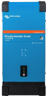
Invertor Phoenix Smart 12/2000